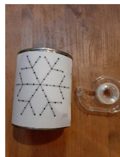
2 - Scotcher le modèle