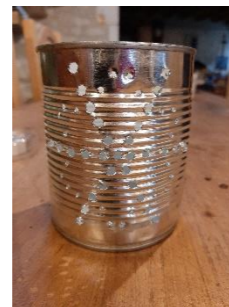
7 - Oter le modèle