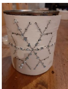
6 - Résultat