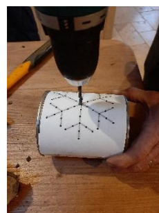
5 - Ou percer avec une perceuse