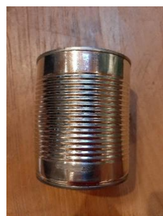
1 - Boîte de conserve métallique vide