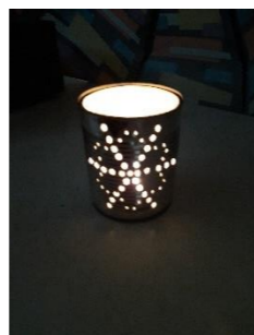
8 - Mettre une bougie chauffe plat

Vous pouvez, si vous le désirez, peindre et décorer la boîte (Ne pas utiliser de matériaux sensibles à la chaleur).