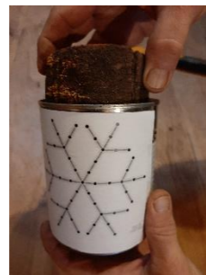
3 - Insérer du bois pour consolider la boîte