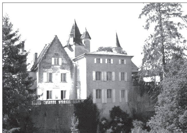
Bourdeilles : la Maison du sénéchal