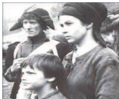
" Jacquou le Croquant " réalisé en 1969 par Stello Lorenzi d'après l'œuvre d'E. Le Roy.